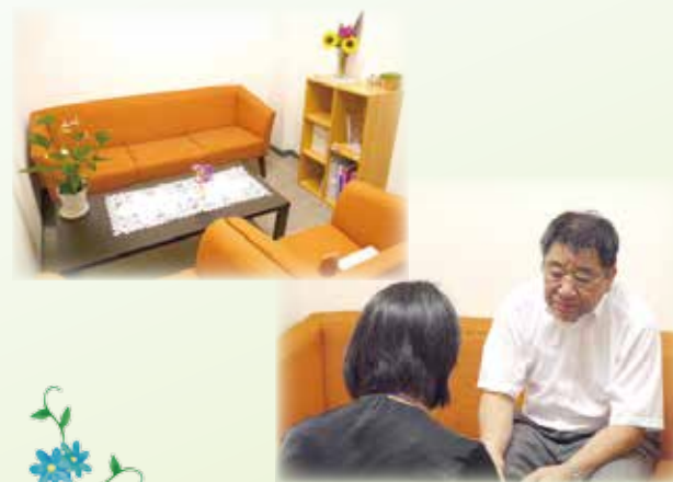
相談室は個室となっております

がんという病気を体験した仲間からのアドバイスは心強く、心の励みにもなります。医師や看護師も参加していますので、普段聞けないことなど質問できる機会です。お気軽にご参加ください。