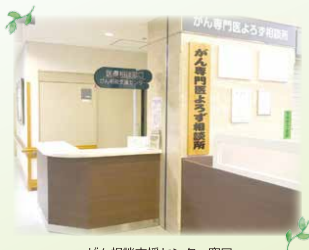
がん相談支援センター窓口