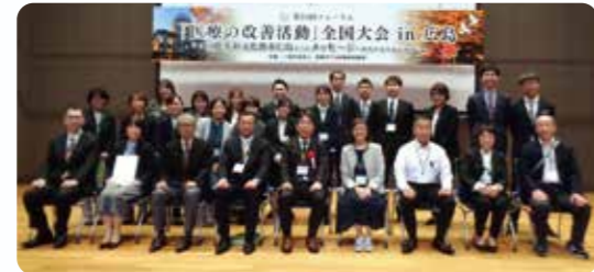
第24回フォーラムの当院参加メンバー