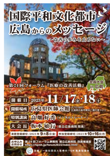
第24回フォーラムのポスター