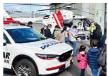
ドクターカーとドクターヘリ

参加した子供たちはドクターカーロゴ入りのユニフォームを試着し、展示しているドクターカーとドクターヘリを間近に見ることが出来て大喜びでした。