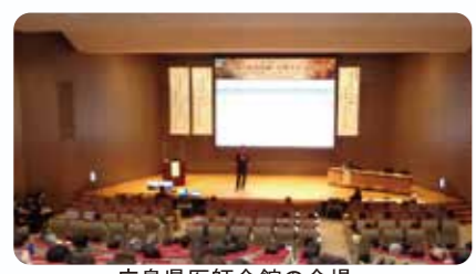
広島県医師会館の会場

来年、この大会は松波総合病院が大会長となり、岐阜県で開催されます。次大会のテーマは働き方改革、経営、IT・AIなど様々な視点から改善を考えて新世代に繋げていくということから「Diversity2024-新世代の改善活動-」となっております。皆さんもぜひ、次大会にご参加いただきますようお願い申し上げます。