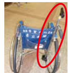
後ろに杖ホルダー

車いすを利用する時に、杖をお持ちの方は杖の置き場に困り、落とした時は、拾うだけで一苦労です。当院では、杖ホルダーを設置している車いすをご用意しておりますので、杖をお持ちの方は、ご利用ください。