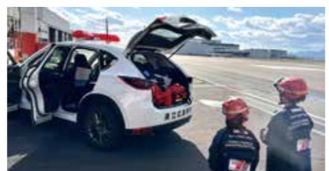
ドクターカーユニフォーム試着してドクターカーを見学