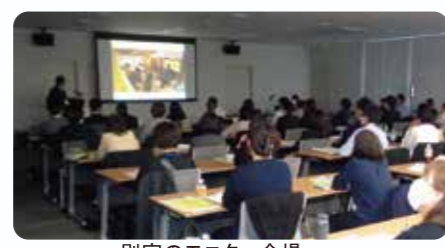
別室のモニター会場