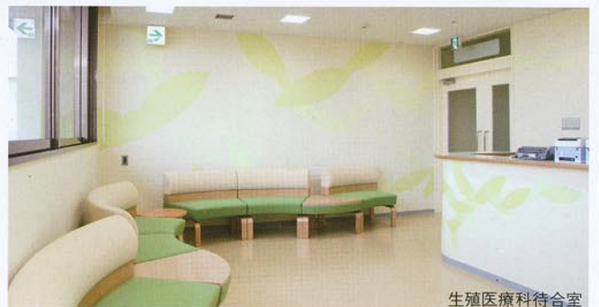
生殖医療科待合室

成育医療 | 妊娠・出生から小児、思春期を経て成人にいたるすべての成長過程の診療を、一元的・継続的に提供する先進的な医療。