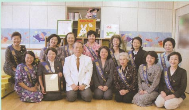
国際ソロプチミスト広島-中央様から、小児科病棟へ入院中の子ども達が少しでも快適に過ごせるようにと、書架、書籍等の寄贈を受けました。（平成19年9月20日）

今後とも、当院の運営に引き続き、ご支援・ご協力を賜りますよう、よろしくお願い申し上げます。