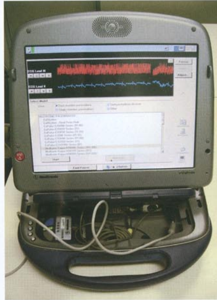
コントローラーを皮膚の上からペースメーカー植え込み部分に当て状態をチェックします。

受診時には、心電図検査（毎回）、ペースメーカー簡易チェック（毎回）、胸部レントゲン検査（隔回）ならびに診察を行います。また手術後初めての受診時、および手術から5年以上経過した場合には、ペースメーカーのリード線の状態や残りの電池寿命などを詳しくみるためにペースメーカークリニックを行います。このクリニックは医師1～2名および看護師2名で診療業務を担当しています。なお、当病院以外で手術を受けられた方についても受診できます。