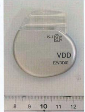
ペースメーカー本体