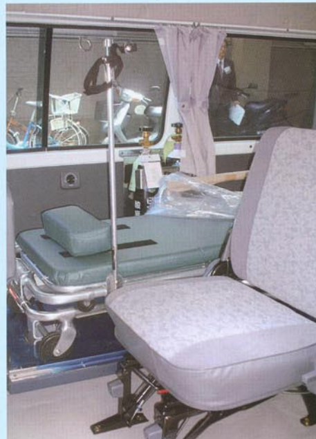
地域医療支援病院の認定要件でもある患者搬送車