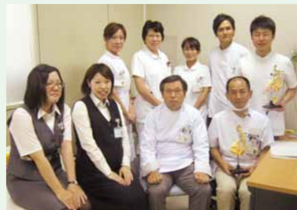
泌尿器科の皆さんです

早期前立腺癌は治療選択枝が多様で丁寧な説明をしております。泌尿器科癌は高齢者に発病することが多く、腎機能低下、心肺などの合併症を有することもあり、病気の進行度だけでなく患者の生活の質（QOL）にも配慮して治療選択をしています。