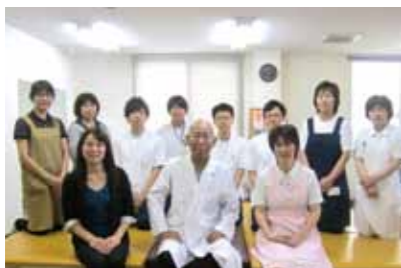
院長先生とスタッフの皆さん