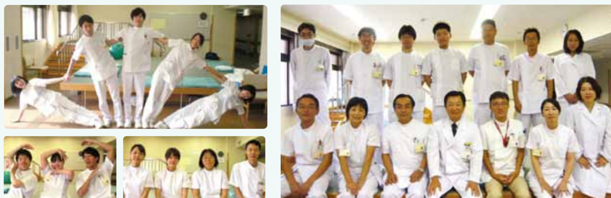
リハビリテーション科スタッフ

当院では、昨年5月からリハビリテーションに土曜日を加えた6日体制を実施しておりましたが、今年6月から日曜日も開始しました。脳卒中や交通事故の入院患者さんたちのリハビリテーションをする機会を増やして、早期の回復と退院につなげます。