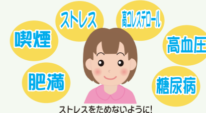
ストレスをためないように!

以上のように若年性心筋梗塞は食生活や生活習慣に気をつけることはもちろんのこと、発症した場合はその原因を明らかにし、再発予防をすることがとても重要です。