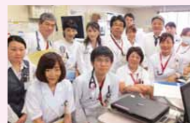
明るく元気でチームワークが良いのが自慢です!

腎臓疾患患者さんへのQOL向上を目指し、昨年度11例の腎臓移植が行われました。専門的知識と研究結果を活かした術前後の管理・苦痛を和らげる援助を行った結果、患者さんは笑顔で退院され、地域・外来・腎センターとの連携により、安心して日常生活を送っていただけます。臨床腫瘍科・放射線治療科は、がんの総合的な医療の提供を目的に、今年度、再編成されました。複数の診療科医師・認定看護師・医療ソーシャルワーカー・薬剤師・管理栄養士等の多職種で連携し、安全で質の高い医療が提供できるよう、常に新しい知識と技術の向上に取り組んでいます。