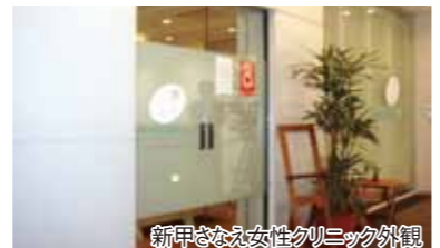
新甲さなえ女性クリニック外観

すべての患者さんがいつも笑顔で帰っていただけることを願うばかりです。お帰りの際に、ここに来てよかったですと言われると、やってよかったと思います。特に、患者さんがご家族やお友達に私共をすすめてください、と来院されると嬉しいですね。